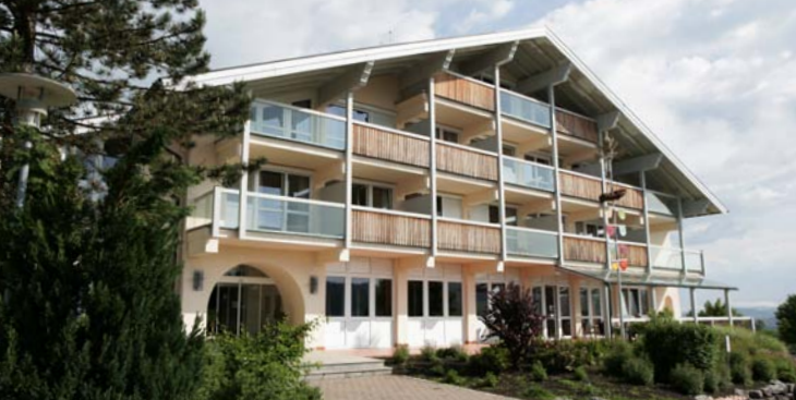
Die Celenus Fachklinik Bromerhof

Die Teilnehmerzahl ist begrenzt. Ihre Anmeldung wird erst nach Eingang der Tagungsgebühr von 35 Euro auf unserem Konto bei der