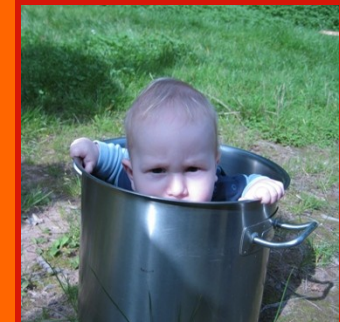
„aus eigener Kraft“

Entwicklung unterstützen - Unterstützung entwickeln