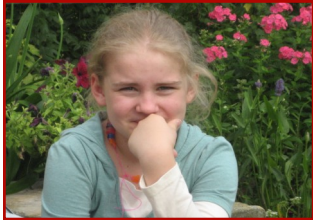
„die Kraft der Bilder“